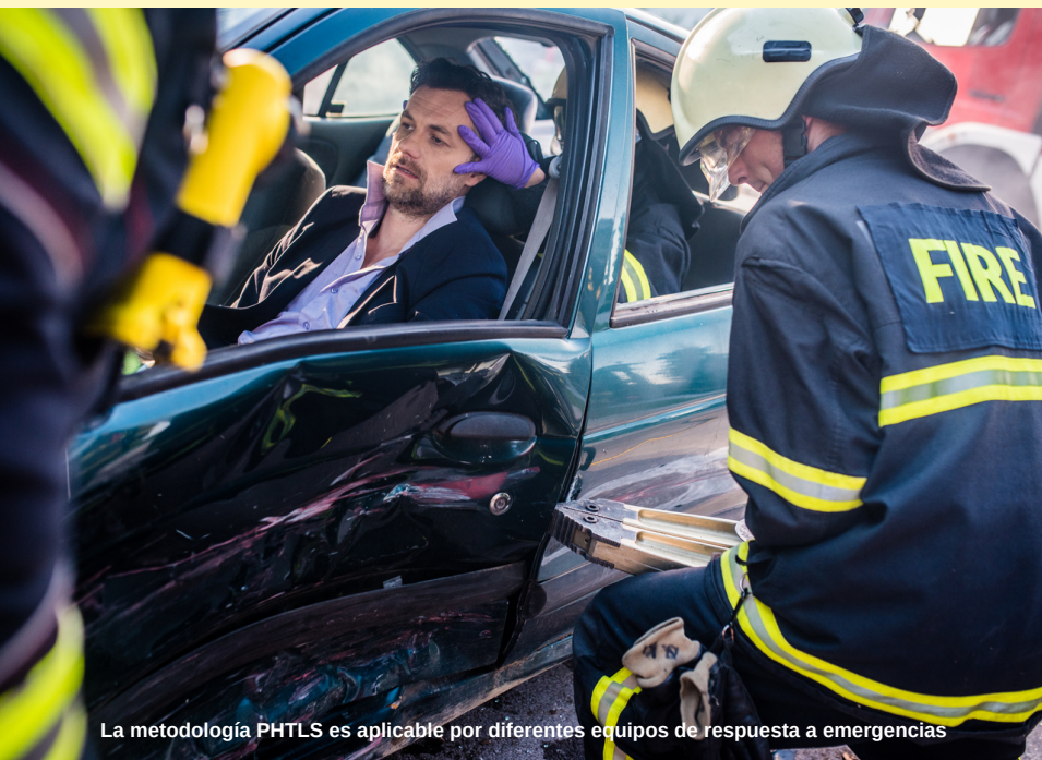
La metodología PHTLS es aplicable por diferentes equipos de respuesta a emergencias

A los participantes que hayan sido inscritos a través de una Empresa o Institución se les hará llegar sus documentos a través de la jefatura a cargo de su inscripción y este envío estará condicionado a la previa cancelación total de las facturas u órdenes de compra correspondientes. El envío de cartas, documentos y certificados es exclusivamente en formato digital. No se entregan correcciones de exámenes a los alumnos.