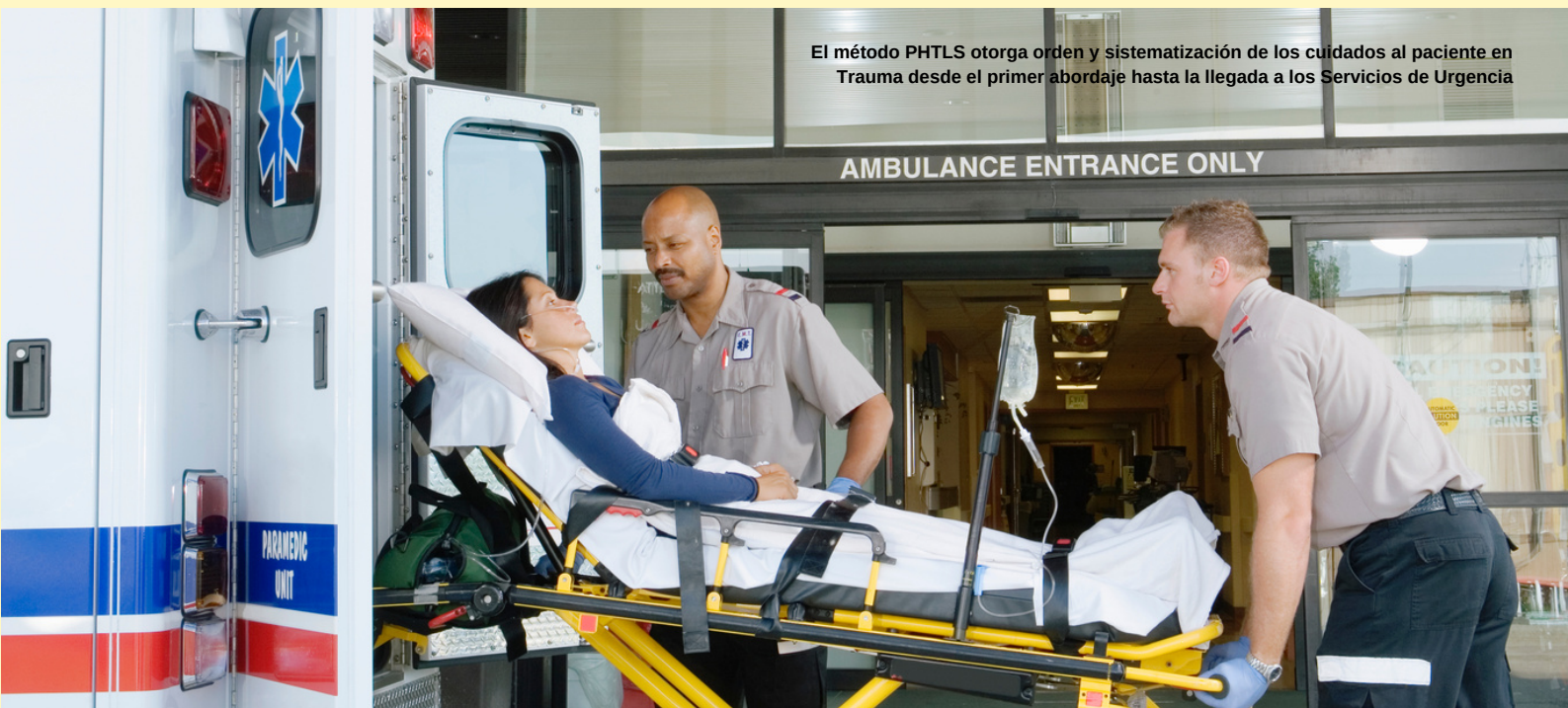
El método PHTLS otorga orden y sistematización de los cuidados al paciente en Trauma desde el primer abordaje hasta la llegada a los Servicios de Urgencia

Los programas de capacitación del COT ACS Chile, por su alto costo operacional, no ofrecen devolución de dinero por concepto de inscripción o materiales. Si a pesar de esto el alumno desea solicitarlo, debe escribir a naemt@acschile.cl explicando las razones, las que serán revisadas por el Comité de Trauma antes de dar respuesta. En casos muy justificados es factible reembolsar un porcentaje de la inscripción, previo descuento por costos de materiales ya entregados y gastos operacionales.