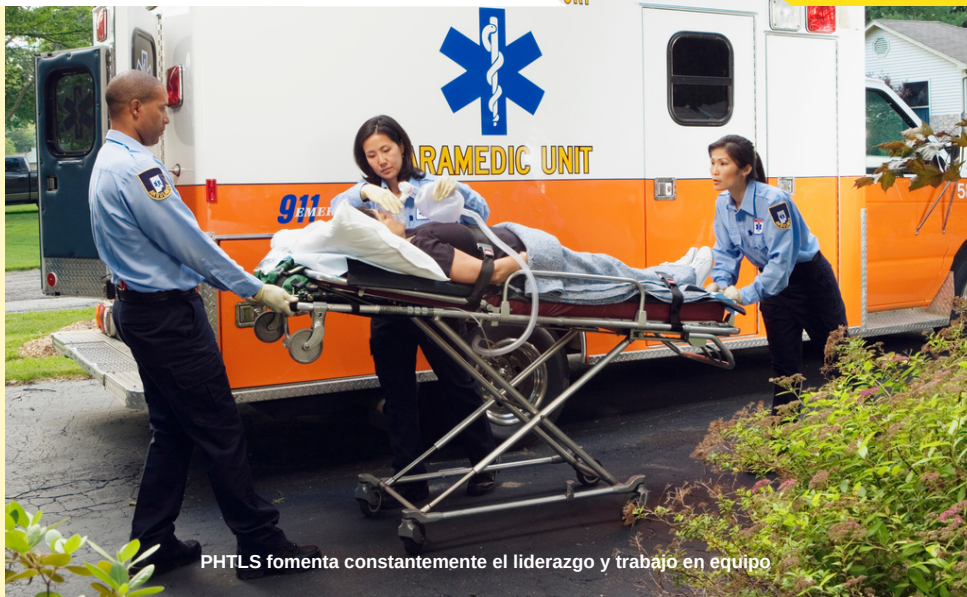
PHTLS fomenta constantemente el liderazgo y trabajo en equipo

Para todos los casos de particulares el curso deberá ser cancelado en su totalidad con anterioridad de la fecha del curso.